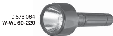
0.873.064 W-WL 60-220