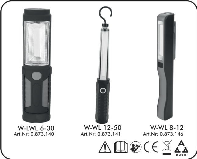
W-LWL 6-30 Art.Nr: 0.873.140

Punjenje ugrađene baterije se vrši preko USB kabla sa računara, laptopa ili USB adaptera.