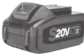
S20V 4.0Ah (712.200.00)