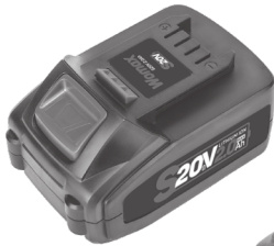
S20V 2.0Ah (712.200.01)

Ove baterije su 100% kompatibilne sa svim alatima serije "Womax S20V" (jedna baterija za više alata)