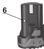
P12 2.0Ah (712.205.00)