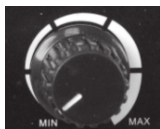
Potenciometar za izbor temperature lemjenja

Lemilica Model: W-LP 50R, 230V, 50Hz, 48W, 150°C-450°C Ova lemilica ima mogućnost odabira temperature lemjenja. Snaga grejača se kreće u rasponu od 8W do 48W.